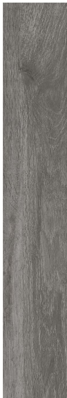
ANTHRACITE - Mat