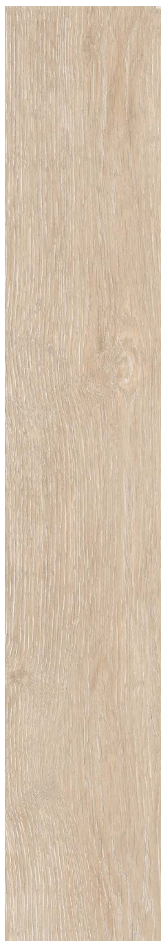
NATURAL - Mat