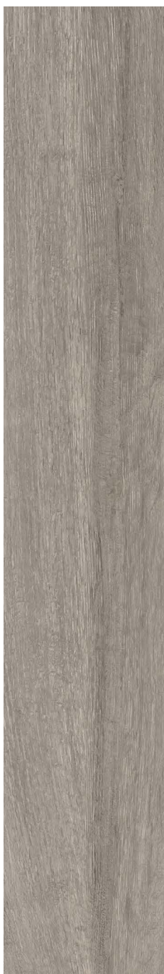
GRIS - Mat